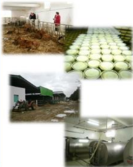
Photos des visites

Cette première série d'entretiens marque le début de la phase diagnostic de la filière laitière prévue par le projet LACTIMED et qui se poursuivra par d'autres entretiens et une enquête auprès des différents maillons de la filière. A l'issue de cette première phase, un plan d'action local va être établi pour répondre aux besoins de la filière laitière.